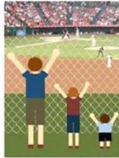
'Nieuwe oplossing: algemeen toegankelijk voor iedereen!'