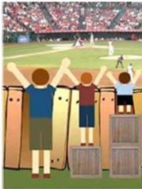
'Iedereen zo behandelen dat de mogelijkheden gelijk zijn'