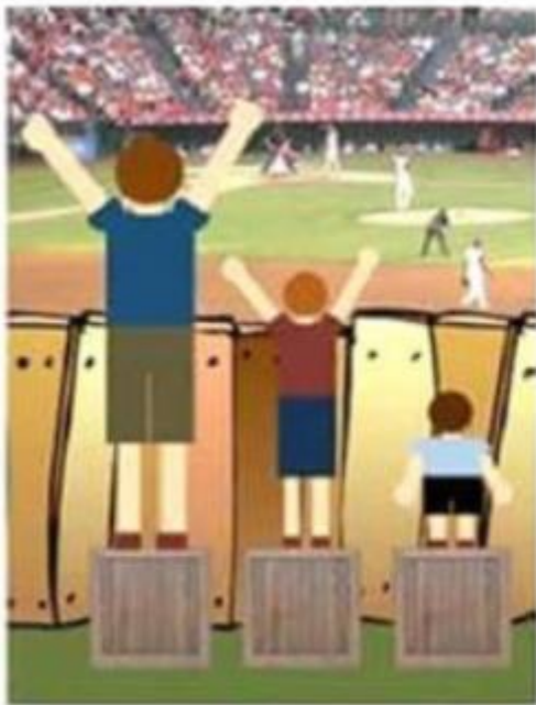
'Iedereen gelijk behandelen'