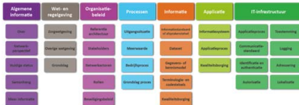
Framework netwerkperspectief in de langdurige zorg

Om zoveel mogelijk aan te sluiten op bestaande initiatieven, is het framework voortgebouwd op de norm NEN-7522 , het interoperabiliteitsmodel van Nictiz en het uitwisselingskompas van VZVZ .