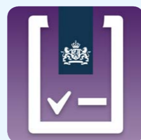
Schermontwerpen van de Mijn Zorg Log-app