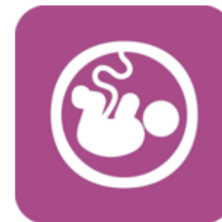
Zwangerschap en geboorte