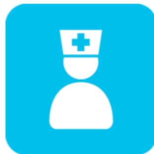
Verpleegkundige overdracht (eOverdracht)